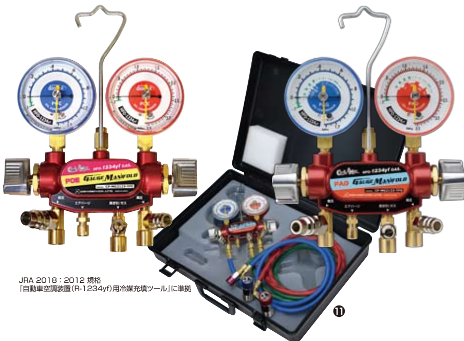
JRA 2018 : 2012 規格 「自動車空調装置 (R-1234yf) 用冷媒充填ツール」に準拠