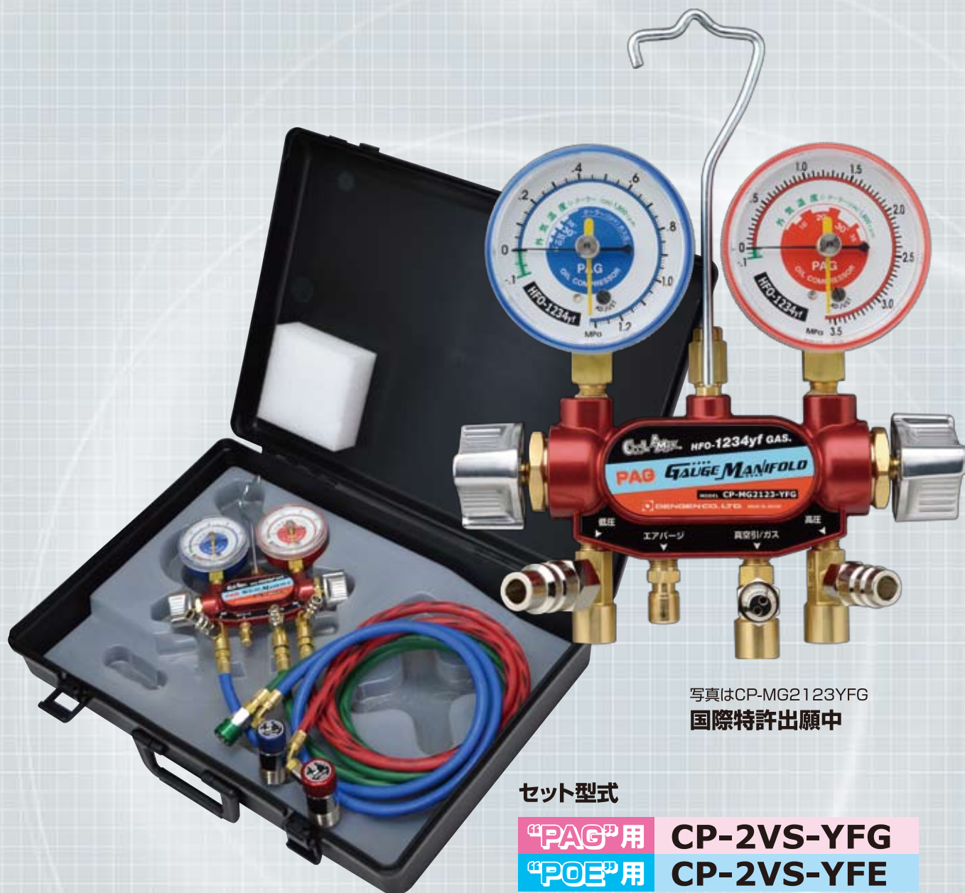
写真はCP-MG2123YFG 国際特許出願中